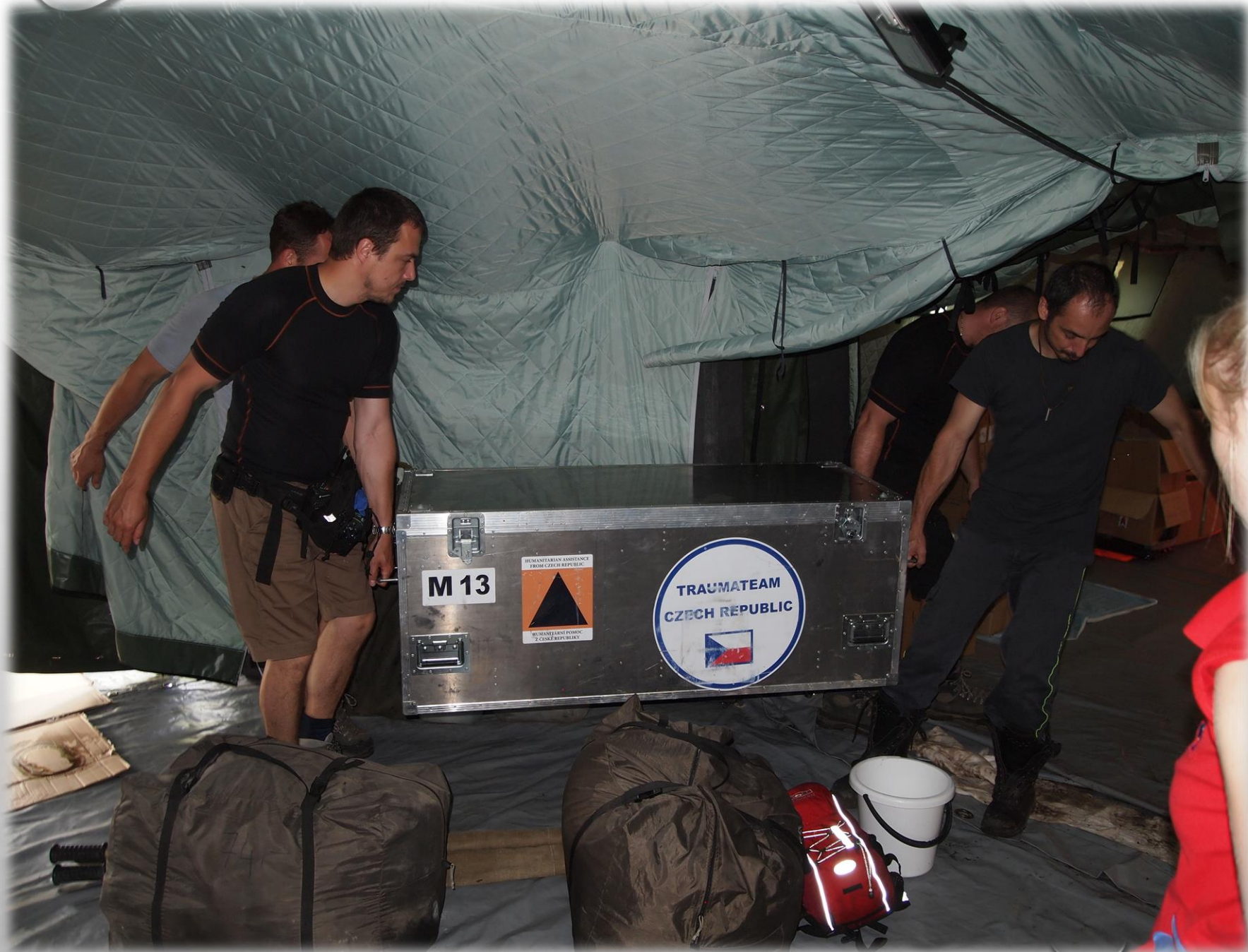
autor: Petr Nestrojil