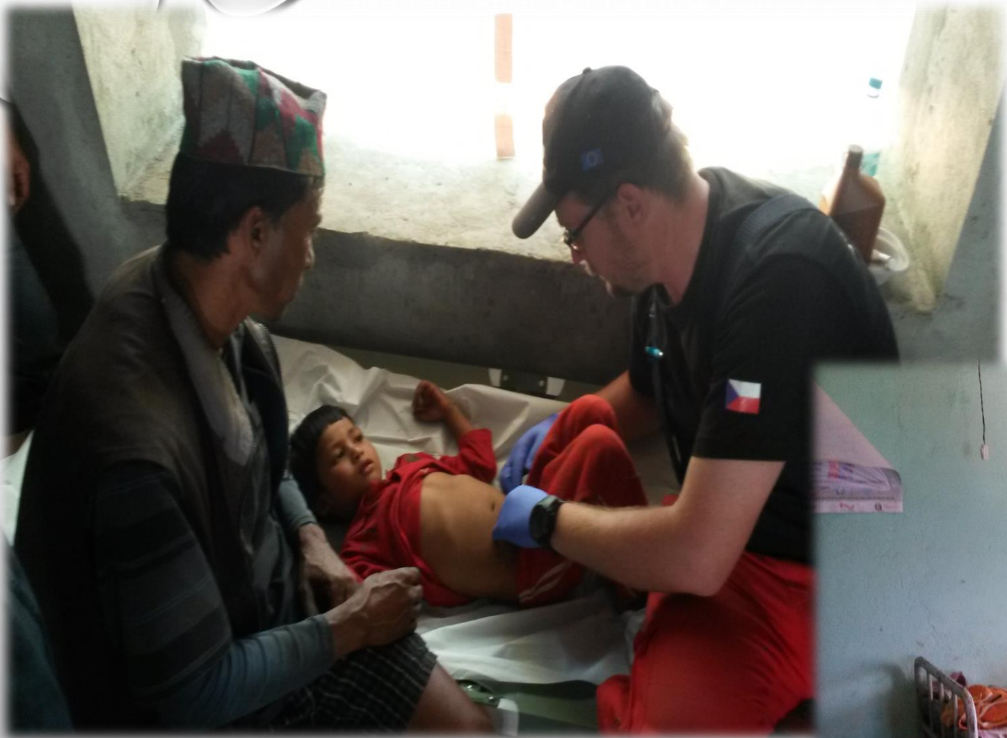
autor: Vladimír Nekuda